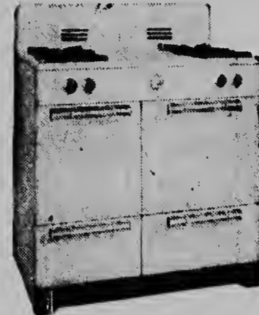
Model 27 - f 320, —